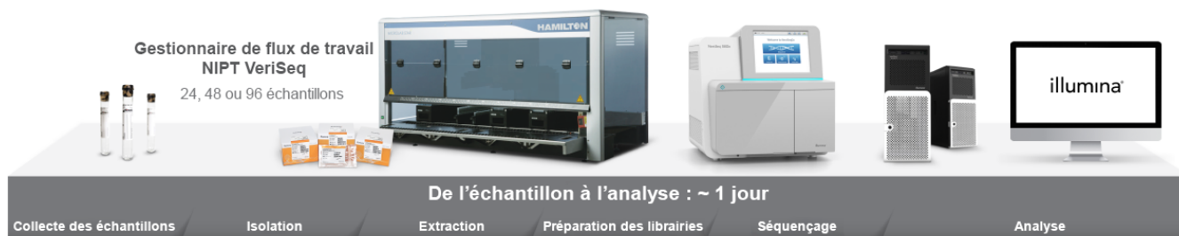
Figure 1 : Flux de travail de DIV exhaustif pour le TPNI – VeriSeq NIPT Solution v2 fournit tout ce dont vous avez besoin pour le TPNI par SNG, notamment les réactifs pour l'extraction de l'ADN, la préparation de bibliothèques et le séquençage; les instruments pour la préparation automatisée des bibliothèques et le séquençage à l'aide d'un gestionnaire de flux de travail; un serveur sur site pour analyser et stocker les données en toute sécurité; et un logiciel d'analyse de données qui génère des rapports avec des résultats qualitatifs.

VeriSeq NIPT Solution v2 est validée pour garantir la fiabilité et la précision clinique. Les échantillons des femmes enceintes ciblées étaient admissibles au test lorsque les résultats cliniques étaient accessibles et répondaient aux critères d'inclusion. La cohorte comprenait des sujets dont l'âge gestationnel était d'au moins 10 semaines, des échantillons à faible fraction fœtale et des grossesses gémellaires. L'étude a été réalisée en analysant plus de 2 300 échantillons de sang maternel, pour lesquels les résultats de trisomie 21, de trisomie 18, de trisomie 13, de RAA, de VNC \geq 7 Mb et de SCA étaient connus. Les résultats de l'analyse au moyen de VeriSeq NIPT Solution v2 ont été comparés aux données de référence clinique.