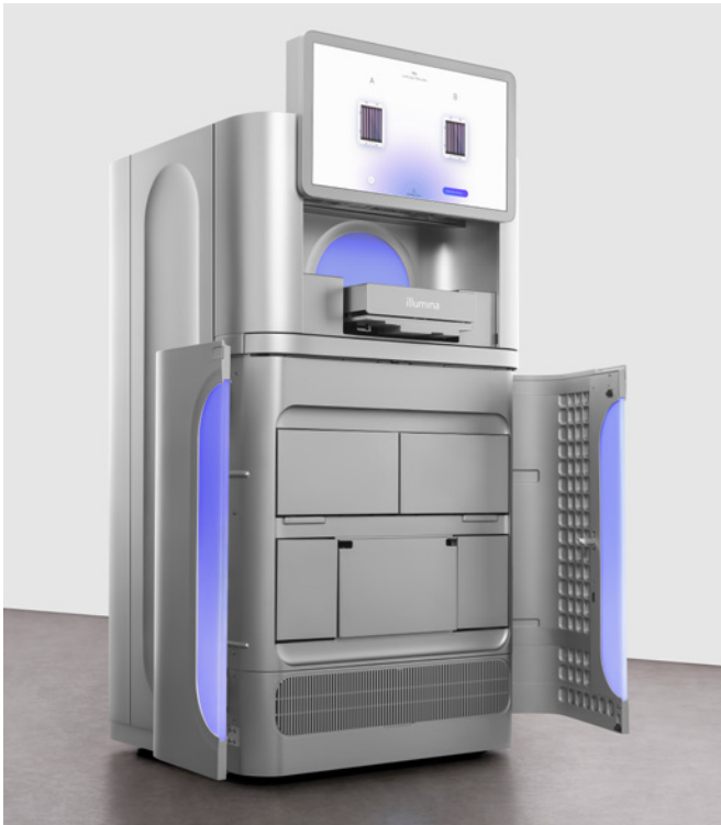
图 5：操作简单 ——NovaSeq X 和 NovaSeq X Plus 系统的多项功能旨在简化测序工作流程，包括高分辨率触摸屏界面和即用型试剂卡盒，支持即装即用操作。