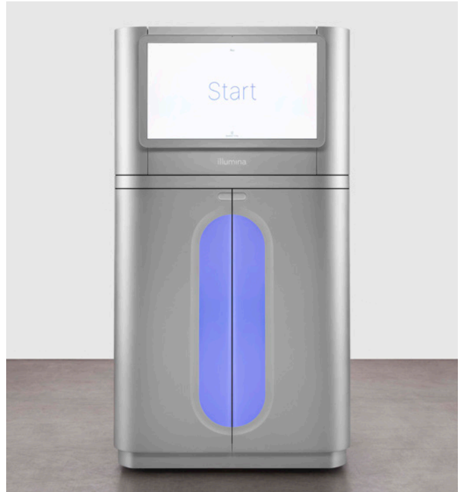
图 1: NovaSeq X 和 NovaSeq X Plus 测序系统——Illumina 的创新持续扩大高通量基因组学技术的可及性，促进科学新见解的产生。