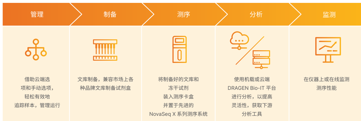
图 4：直观、优化的高通量测序工作流程——NovaSeq X 和 NovaSeq X Plus 测序系统提供了一个全面的工作流程，包括对用户友好的运行设置、广泛的文库制备试剂盒兼容性和集成二级分析等性能。