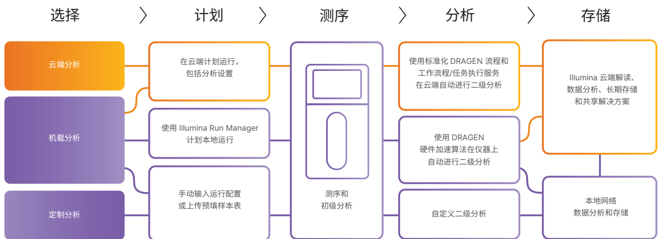
图 6：灵活的生信分析套件 ——NovaSeq X 和 NovaSeq X Plus 系统在运行设置、运行管理和数据分析方面具有本地（紫色）和云端（橙色）两个选项，让用户能够以自己的方式运行测序。