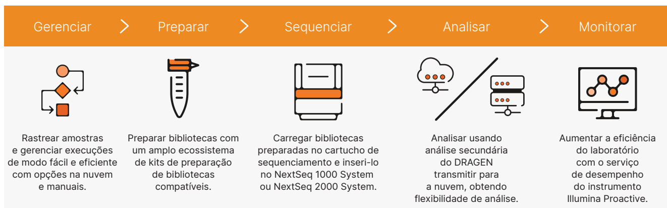
Figura 2: Fluxo de trabalho intuitivo da biblioteca para a análise: os sistemas NextSeq 1000 e NextSeq 2000 fornecem um fluxo de trabalho abrangente que inclui a configuração da execução fácil de usar, um amplo ecossistema de kits de preparação de bibliotecas compatíveis, operação pronta para uso e análise secundária integrada.