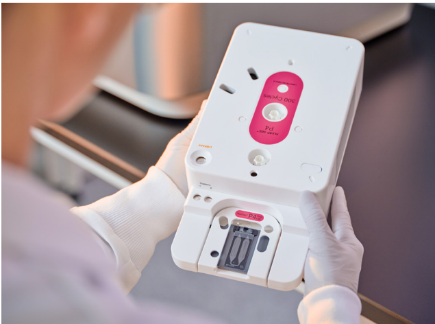
Figura 4: Cartucho de reagente dos sistemas NextSeq 1000 e NextSeq 2000: o cartucho integrado inclui reagentes, fluidos e suporte para resíduos. Basta descongelar e preparar o cartucho de reagente, inserir a lâmina de fluxo, carregar a biblioteca e introduzir o cartucho no instrumento.

Os reagentes nunca deixam o cartucho, resultando em um design de instrumento seco que não requer limpeza, permite a manutenção simplificada do instrumento e otimiza a eficiência do instrumento.