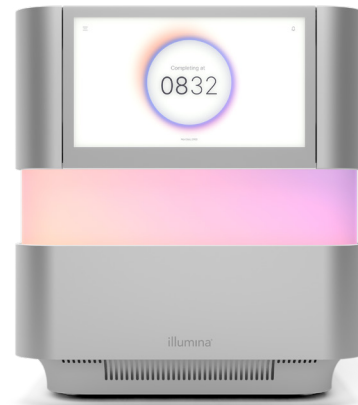
Figura 1: NextSeq 2000 Sequencing System: o NextSeq 2000 System oferece recursos de design inovadores, química avançada, bioinformática simplificada e um fluxo de trabalho intuitivo que possibilita a mais ampla gama de aplicações e flexibilidade de escala em um sistema de sequenciamento de bancada.

Os sistemas NextSeq 1000 e NextSeq 2000 usam a química XLEAP-SBS, que é mais rápida, de qualidade mais alta e mais robusta, desenvolvida sobre a base consolidada da química de SBS Illumina padrão. Os nucleotídeos XLEAP-SBS usam corantes de última geração e novos ligantes e blocos que são mais resistentes ao calor. Eles mostram uma redução de 50x na hidrólise e uma clivagem de bloco 2,5x mais rápida para reduzir o faseamento e o pré-faseamento. A polimerase XLEAP-SBS foi projetada para incorporar nucleotídeos mais rapidamente e com uma fidelidade inigualável.