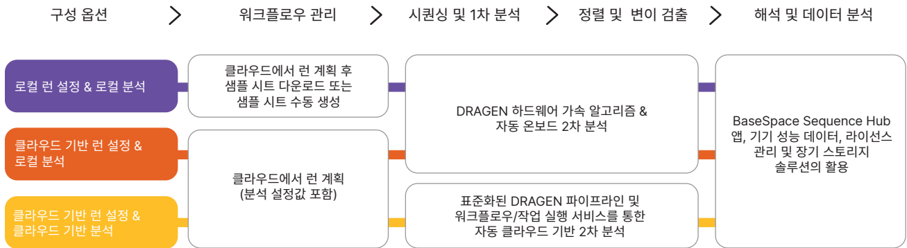
그림 5: 유연한 인포매틱스 제품군 — 연구자가 로컬 또는 클라우드 기반 런 설정, 런 관리, 데이터 분석 옵션을 선택해 원하는 대로 시퀀싱을 수행할 수 있도록 해 주는 NextSeq 1000 및 NextSeq 2000 시스템