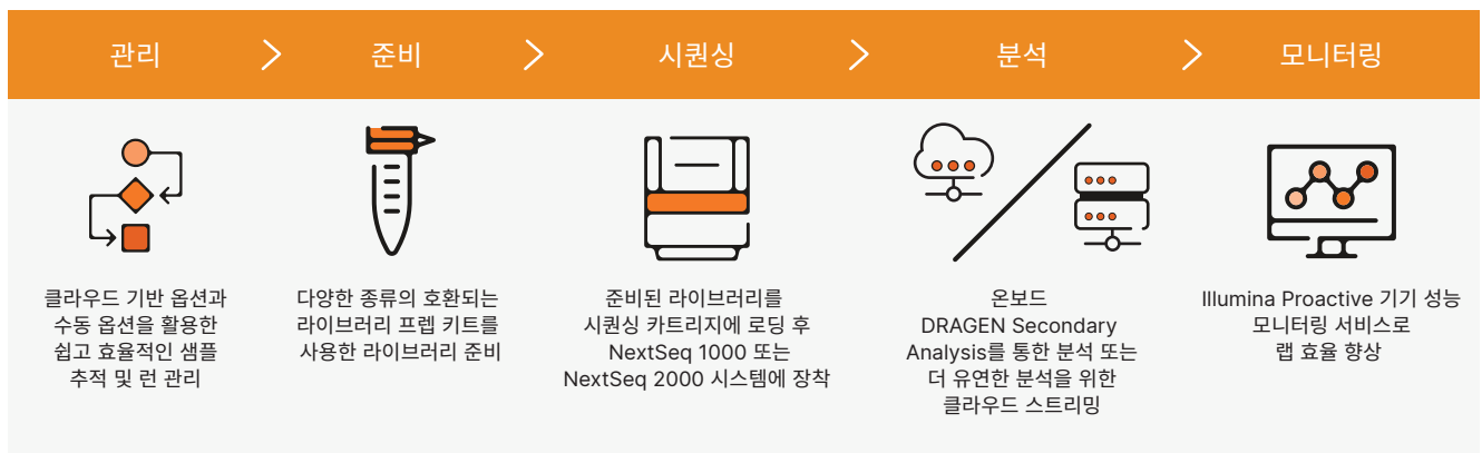
그림 2: 라이브러리 준비부터 분석까지 가능한 직관적인 워크플로우 — 쉬운 런 설정, 다양한 종류의 호환 가능한 라이브러리 프랩 키트, 로딩만 하면 수행되는 시퀀싱, 통합된 온보드 2차 분석을 포함하는 포괄적인 워크플로우를 제공하는 NextSeq 1000 및 NextSeq 2000 시스템