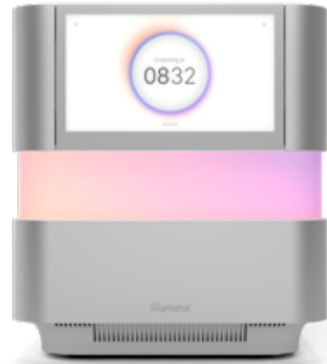
그림 1: NextSeq 2000 시퀀싱 시스템 — 매우 광범위한 애플리케이션과 규모의 유연성을 지원하는 혁신적인 디자인 요소, 진보된 chemistry, 간소화된 바이오인포매틱스 및 직관적인 워크플로우를 제공하는 벤치탑 시퀀싱 시스템