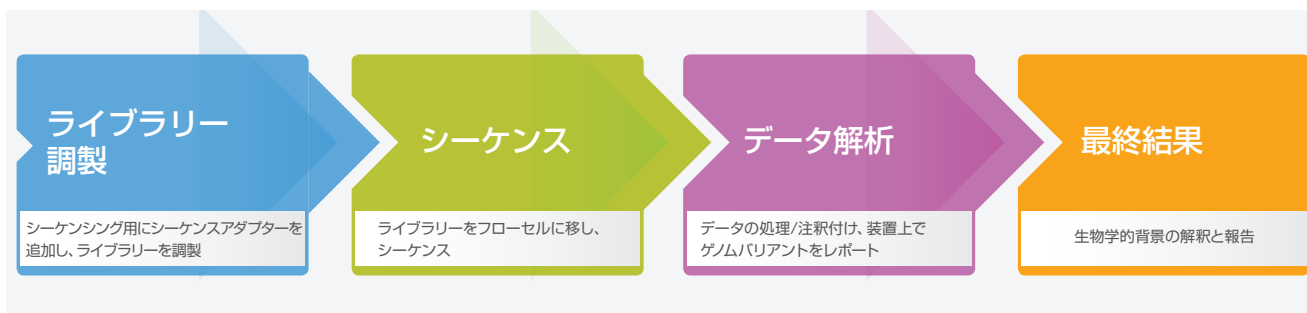
図2: MiSeqシステムのワークフロー: MiSeqシステムの効率的なワークフローにより、次世代ベンチトップシーケンスの迅速なターンアラウンドタイムが実現します。ライブラリーは、互換性のあるライブラリー調製キットで調製できます。5時間半のシーケンス時間には、MiSeq Controlソフトウェアを搭載したMiSeqシステムで25 bp × 2のランを実施した場合のクラスター形成、シーケンス、クオリティスコア付きのベースコーリングが含まれます。

迅速なライブラリー調製とMiSeqシステムを組み合わせることで、シンプルで迅速なターンアラウンドタイムが実現し、数日ではなく数時間で結果を得ることができます (図2)。Illumina DNA Prepライブラリー調製試薬を使用して、わずか3時間でシーケンスライブラリーを調製し、その後MiSeqシステムで自動化されたクローン増幅、シーケンス、およびクオリティスコア付きのベースコーリングをわずか5.5時間で実施します (表1)。シーケンスアライメントは、MiSeq Local Run Managerソフトウェアを使用して装置内のコンピューター上で直接、またはBaseSpace Sequence Hubを介して3時間以内で完了することができます。