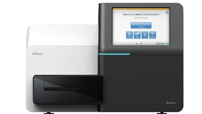
図1: MiSeqシステム: コンパクトなMiSeqシステムは、迅速でコスト効率の良い次世代シーケンスに最適です。

MiSeqシステムは、クラスター形成、増幅、シーケンシング、およびデータ解析を単一の装置に統合し、「DNAからデータ取得まで」を実現した初めてのシーケンシングプラットフォームです。設置面積が約2平方フィートと小さいため、ほぼすべてのラボ環境に簡単にフィットします (図1)。MiSeqシステムは、イルミナのSequence by Synthesis (SBS) ケミストリーを利用していません。このケミストリーは、世界のシーケンスデータの90%以上を生成している実績のある次世代シーケンシング (NGS) テクノロジーです。 1 MiSeqシステムはコンパクトなサイズながらNGSのパワーを提供し、迅速でコスト効率の良い遺伝子解析のための理想的なプラットフォームです。