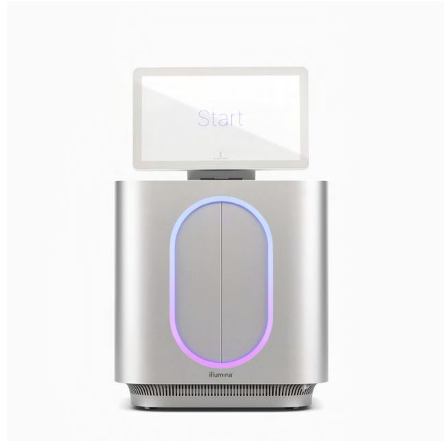
그림 1: MiSeq i100 및 MiSeq i100 Plus 시퀀싱 시스템 — Illumina의 기술 혁신은 계속해서 간편성과 신속함에 중점을 둔 벤치탑 시스템으로 NGS의 접근성을 높이고 있음

Illumina는 고객 경험을 최우선으로 한 혁신적인 기술을 제공함으로써 최대한 간편한 라이브러리 준비, 시퀀싱 및 데이터 분석 프로세스를 지원하고 있습니다. MiSeq i100 시리즈 워크플로우의 모든 구성 요소는 프로젝트의 완수에 요구되는 시간과 리소스를 크게 줄일 수 있도록 최적화되어 있습니다(그림 2). MiSeq i100 및 MiSeq i100 Plus 시스템은 런(run) 설정을 단 3단계에 걸쳐 20분 안에 완료할 수 있는 간소화된 워크플로우를 제공합니다. 로딩만 하면 되는 시약 카트리지와 소모품은 실온 배송 및 보관되므로 시퀀싱 단계 전 시약이 해동되기를 기다릴 필요가 없습니다. 직관적인 인포매틱스(informatics, 정보학)로 터치포인트를 간소화하고 바이오인포매틱스(bioinformatics, 생명정보학) 전문가의 필요성을 최소화해 간편한 분석을 지원하는 초보자와 전문가 모두에게 유용한 시스템입니다.