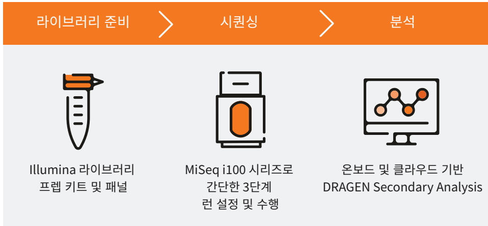
그림 2: 직관적이고 간소화된 워크플로우를 통해 NGS로의 원활한 전환을 지원하는 MiSeq i100 및 MiSeq i100 Plus 시퀀싱 시스템