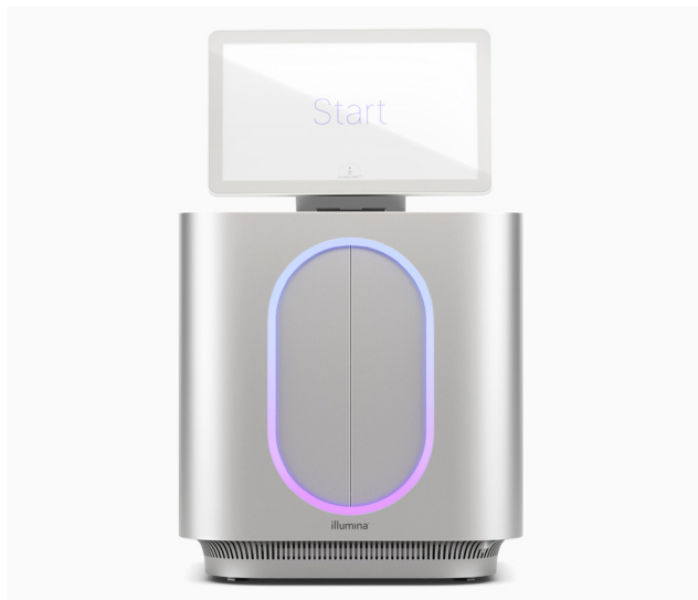
Figura 1: MiSeq i100 Sequencing System y MiSeq i100 Plus Sequencing System: la innovación de Illumina continúa ampliando el acceso a la NGS con sistemas de sobremesa diseñados para la simplicidad y la velocidad.

En Illumina, situamos la experiencia del cliente en el centro de cada innovación, facilitando todo lo posible la preparación de librerías, la secuenciación y el análisis de datos. Se han optimizado todos los aspectos del flujo de trabajo de MiSeq i100 Series para reducir al mínimo el tiempo y los recursos necesarios para realizar los proyectos (figura 2). MiSeq i100 System y MiSeq i100 Plus System ofrecen un flujo de trabajo simplificado con una configuración del experimento completa en solo tres pasos y en menos de 20 minutos.