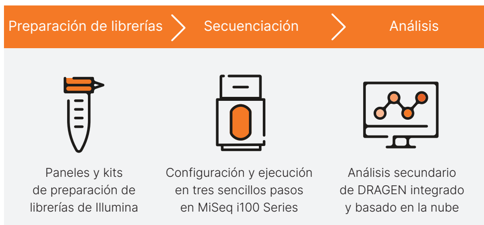
Figura 2: MiSeq i100 Sequencing System y MiSeq i100 Plus Sequencing System ofrecen un flujo de trabajo intuitivo y simplificado para facilitar la transición a la NGS.