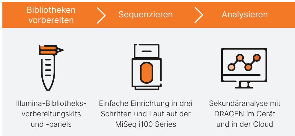
Abbildung 2: Das MiSeq i100 Sequencing System und das MiSeq i100 Plus Sequencing System bieten einen intuitiven und vereinfachten Workflow, der die Umstellung auf NGS erleichtert.