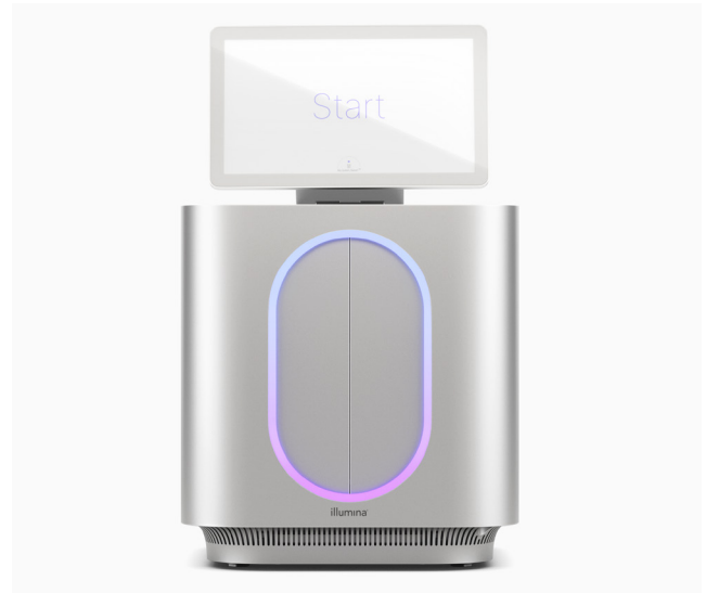
Abbildung 1: MiSeq i100 Sequencing System und MiSeq i100 Plus Sequencing System: Die Innovation von Illumina erleichtert den Zugang zu NGS mit Labortischsystemen, die auf Anwenderfreundlichkeit und Geschwindigkeit ausgelegt sind.

Die Kundenerfahrung steht bei allen Innovationen von Illumina im Mittelpunkt. Dadurch werden Bibliotheksvorbereitung, Sequenzierung und Datenanalyse so stark wie möglich vereinfacht. Jeder Aspekt des Workflows der MiSeq i100 Series ist dahingehend optimiert, den Zeit- und Arbeitsaufwand für die Durchführung von Projekten zu minimieren ( Abbildung 2 ).