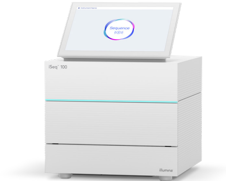
Figure 1 : Le système iSeq 100 : il tire parti de la puissance du séquençage de nouvelle génération (SNG) dans le système de séquençage de paillasse le plus abordable et compact de la gamme de produits d'Illumina.

Le système iSeq 100 s'intègre dans un flux de travail rationalisé en trois étapes qui comprend la préparation des librairies, le séquençage et l'analyse des données (figure 2).