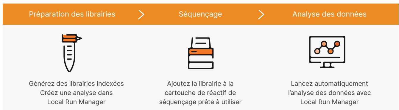
Figure 2 : Le système iSeq 100 s'intègre dans un flux de travail rationalisé, de l'ADN aux données.

Le système iSeq 100 est compatible avec toute la gamme des trousse de préparation de librairies d'Illumina. Avec les trousse de préparation de librairies d'ADN Nextera MC XT et Illumina DNA Prep, les chercheurs peuvent préparer des librairies multiplexées en 3 ou 4 heures pour le séquençage de petits génomes ou le séquençage direct de longs amplicons. De plus, AmpliSeq MC for Illumina Targeted Resequencing Solution offre du contenu conçu par des spécialistes et présenté sous forme de panels fixes prêts à l'utilisation, de panels conçus par la communauté scientifique ou de panels personnalisés répondant à des besoins précis pour la recherche. Selon la version choisie, les trousse de préparation de librairies d'Illumina peuvent ne nécessiter que 1 ng d'ADN ou d'ARN (ADNc) d'entrée et prendre en charge l'ADN extrait d'échantillons fixés au formol et inclus en paraffine (FFIP), tels que des tissus tumoraux préservés.