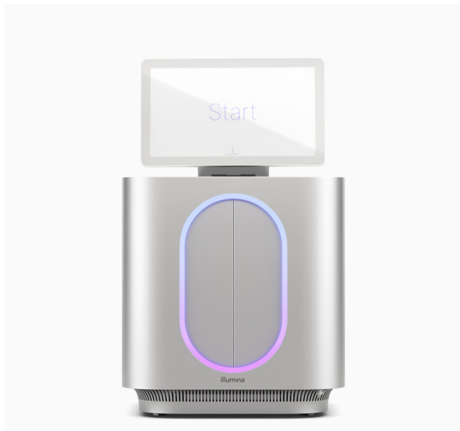
图1: MiSeq i100和MiSeq i100 Plus基因测序仪——借助专为简便和快速而设计的桌面式基因测序仪，因美纳的创新技术不断扩展NGS的可及性。

因美纳每项创新都以客户体验为核心，我们一直尽可能地帮助用户轻松开展文库制备、测序和数据分析。MiSeq i100系列分析流程经过全方位优化，大幅减少完成项目所需的时间和资源（图2）。MiSeq i100和MiSeq i100 Plus基因测序仪提供的简化分析流程，仅需三个步骤即可在20分钟之内完成运行设置。即插即用装试剂卡盒和耗材可在室温下运输和储存，因此测序前无需等待试剂解冻。直观的信息学分析大幅减少了手动操作，并且无需专业生物信息学家介入，有效简化分析，让新用户和高级用户都可以从中受益。